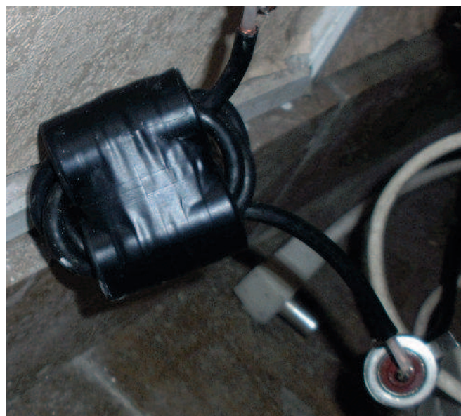
Le coaxial est enroulé sur deux piles de tores formant deux tubes. Le principe de ce système permet de n'avoir qu'un petit nombre de spires pour obtenir une forte impédance.