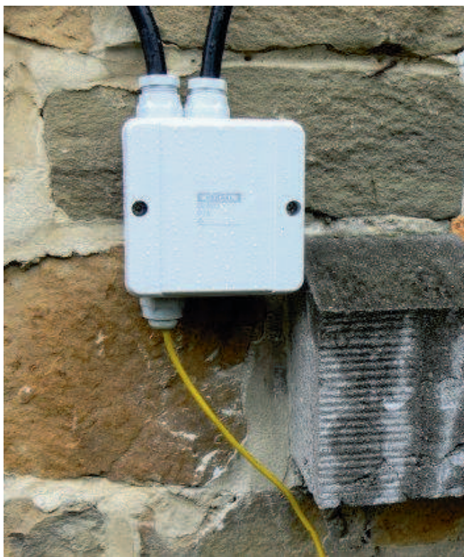
Le boîtier terminé et vissé en place. C'est propre et net. Si le coaxial avait été un peu plus long, il aurait pu être placé sous la fenêtre pour une meilleure protection contre les intempéries.