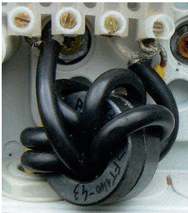
Le choke balun.

Il a été bobiné sur deux tores correspondant à des FT140-43 pour avoir une inductance suffisante.