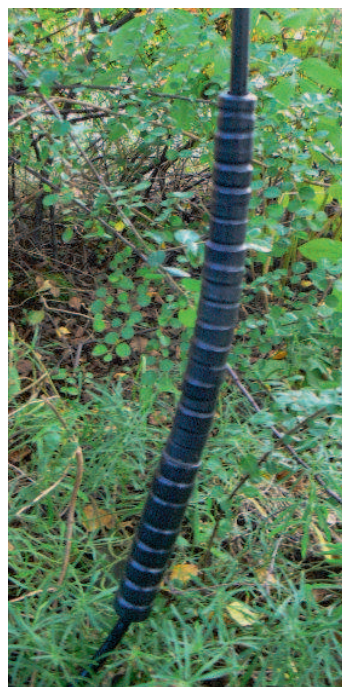
Un empilement de tores et de tubes en ferrite sur une longueur de 30cm. Les tores du haut (côté antenne) sont ceux qui ont la plus faible perméabilité pour limiter les pertes sur les bandes hautes. En effet, ce choke-balun doit renvoyer la HF vers l'antenne ou la rayonner sans rien perdre.