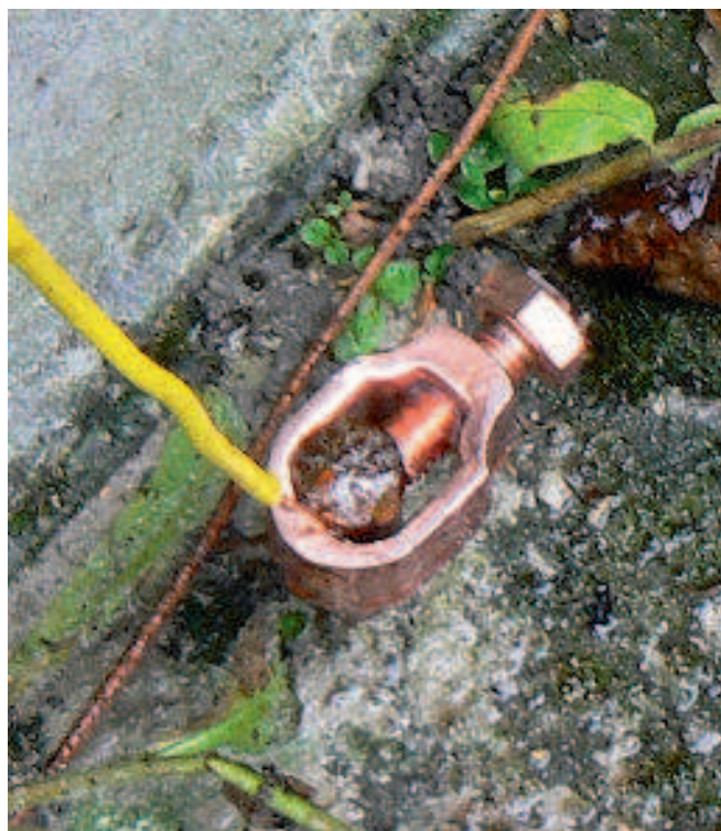
Le piquet de terre.

Un trou de 20mm a été foré dans le carrelage et le piquet de 1,80m a été enfoncé à la masse dans le sol. Le raccord en cuivre est celui qui a été prévu pour cet usage.